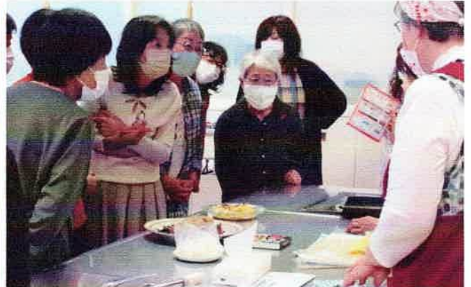
10/5 食品ロス削減講座 さっぽろスリムネット受託事業① “いつも”のついでに、ローリングストック 於:札幌エルプラザ