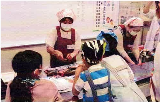
9/23親子秋さけ食育講座 共催:北海道定置漁業協会 秋さけの“ふしぎ”にせまる～さけから学ぶ、 いのちのつながり～ 於:札幌エルプラザ

TEL:011-728-8300 / FAX:011-728-8301 〒060-0808 札幌市北区北8条西3丁目札幌エルプラザ2F https://www.sapporo-shohisha.or.jp/