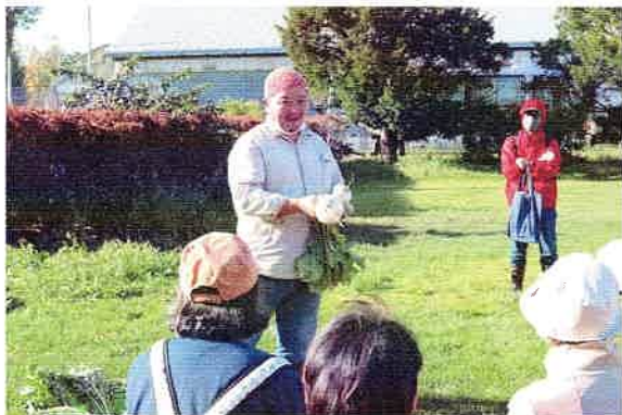
10/12 食品ロス削減講座 さっぽろスリムネット受託事業② 「畑の“ふぞろい”を楽しもう」～背景を知ると買い物が変わる～ 於:八紘学園